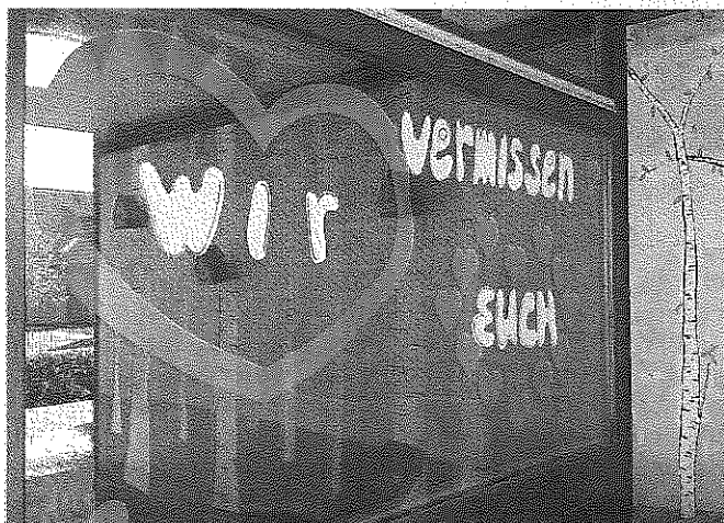
„Wir vermissen euch“ ist auf der Eingangstür der Kindertagesstätte St. Lambertus zu lesen.